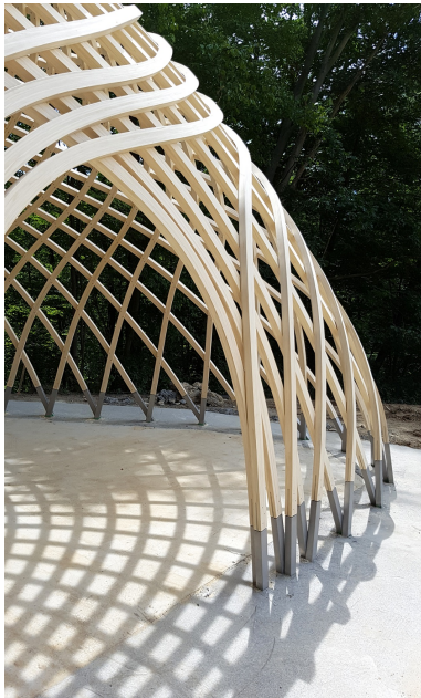
Detailansicht Free Form-Konstruktion