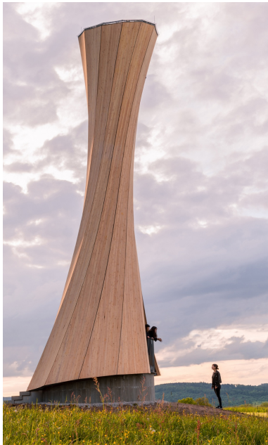
Eine Lärchenfassade umhüllt den Turm