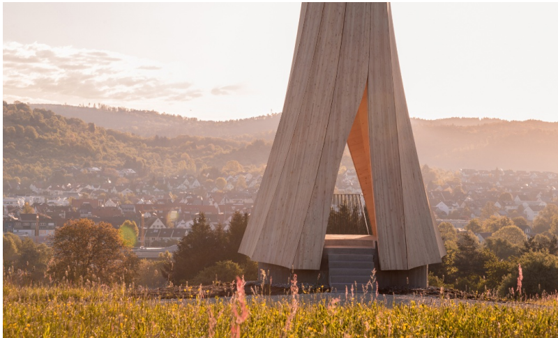
14.2 Meter hoher Turm aus Fichten-CLT